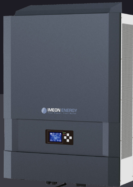
IMEON 9.12 Jusqu'à 12kWp Triphasé