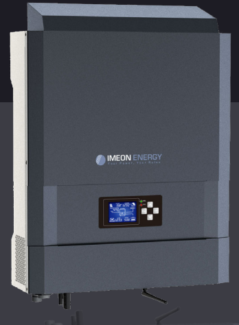
IMEON 3.6 Jusqu'à 4kWp Monophasé